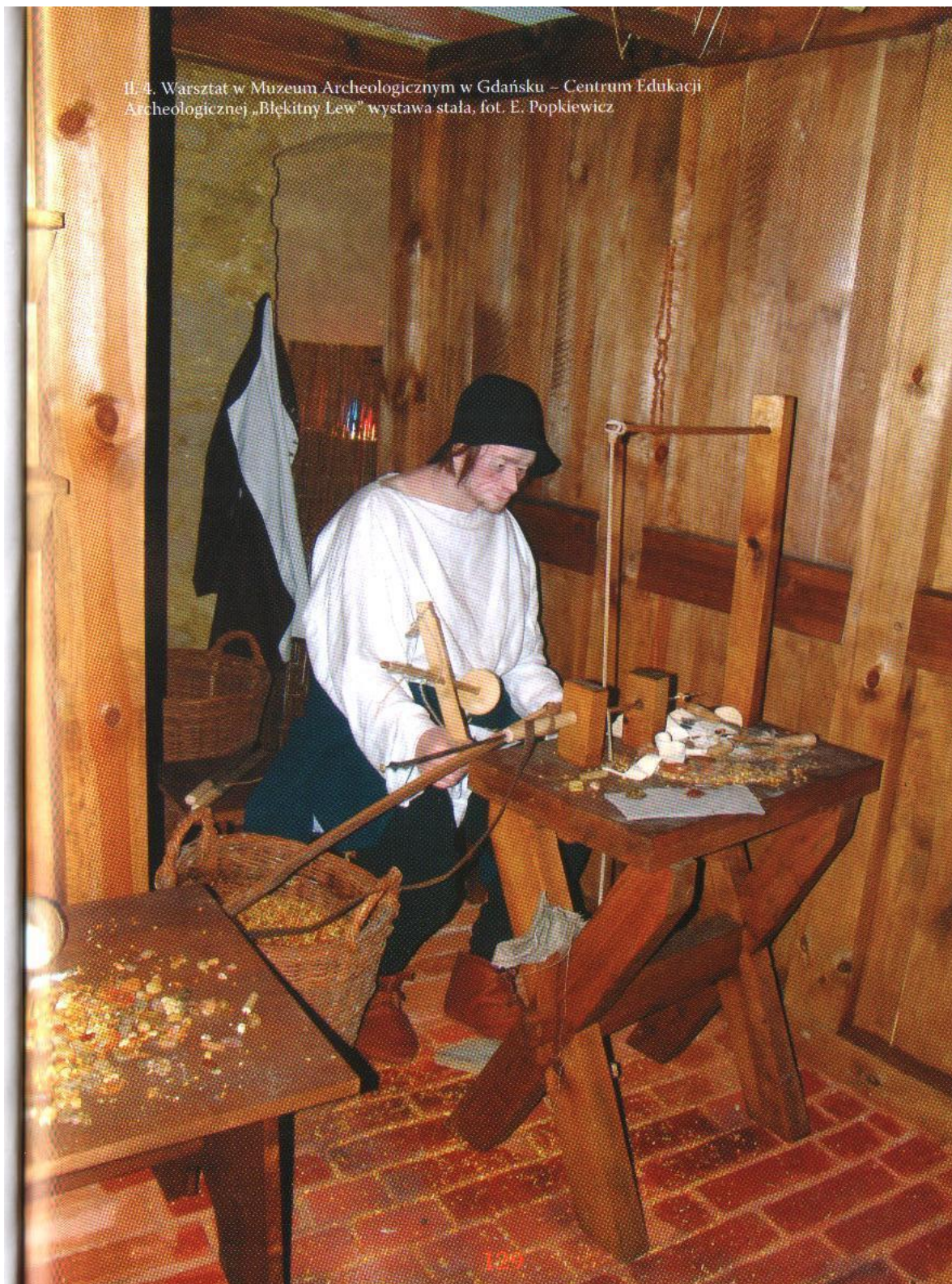
H. 4. Warsztat w Muzeum Archeologicznym w Gdańsku – Centrum Edukacji Archeologicznej „Błękitny Lew” wystawa stała