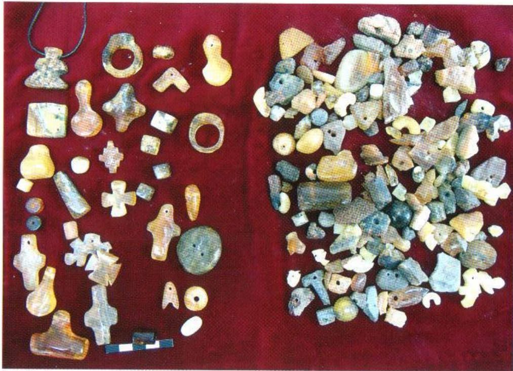
Il. 1. Zrekonstruowane produkty, półprodukty, odpady z warsztatu bursztyenniczego – Muzeum Archeologiczne w Gdańsku – Centrum Edukacji Archeologicznej „Błękitny Lew” wystawa stała

ściśle naukowym. Celem odtwarzania warsztatów bursztyennicznych jest przybliżenie historii rzemiosła w jak najbardziej dostępny sposób, aby zwiedzający mógł na własne oczy zobaczyć do czego służyły i jak wyglądały przedmioty dawnej kultury materialnej (dziś przeważnie niekompletne lub zniszczone przez czas i środowisko 1 ). Dlatego powstaje potrzeba ożywienia ich funkcji poprzez pokazy, które z kolei rodzą potrzebę tworzenia kopii eksponatów (il. 1)